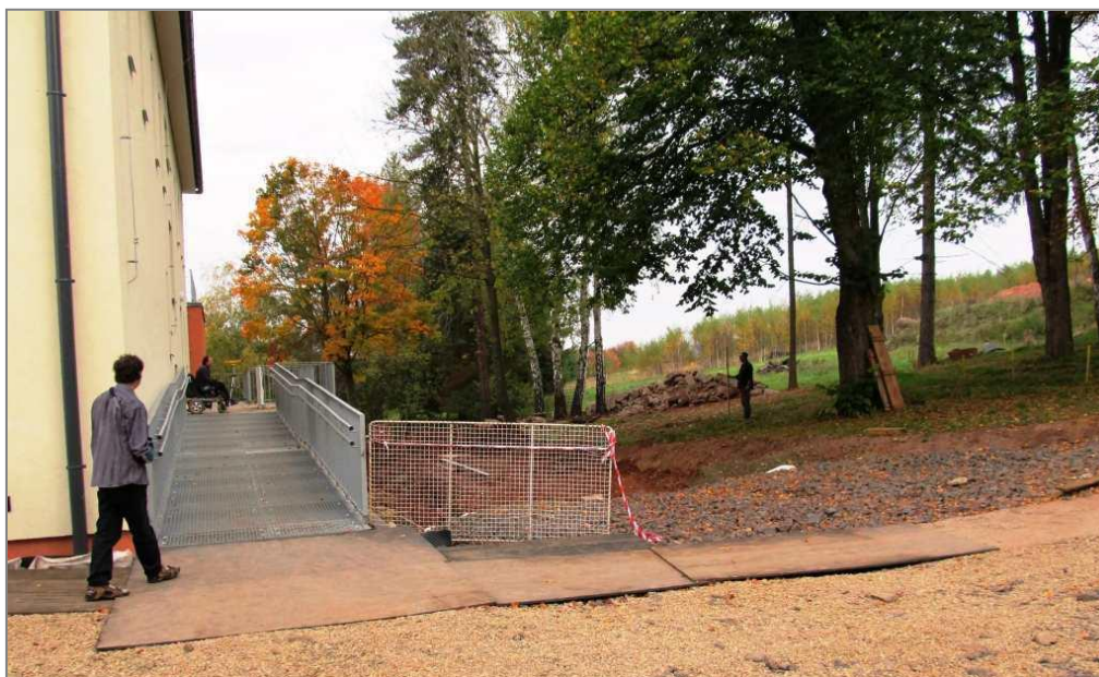
Pokládka kanalizace na jižní straně objektu CBB – září 2012