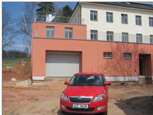
Jižní prostranství a hlavní vchod do budovy Centra bez bariér. Duben 2013