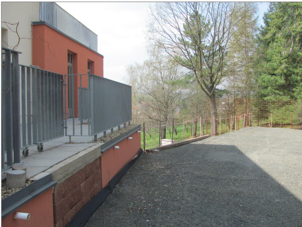
Zadní vchod do budovy objektu Centra bez bariér a severní prostranství, které bude v budoucnosti využíváno pro relaxační a sportovní aktivity. Duben 2013

Následující fotografie zachycují některé z doposud realizovaných prací v rámci úprav venkovního prostranství objektu CBB, práci dobrovolníků apod.