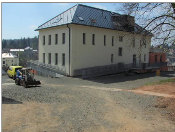
V současné době používaný zadní vchod do budovy Centra bez bariér. Duben 2013