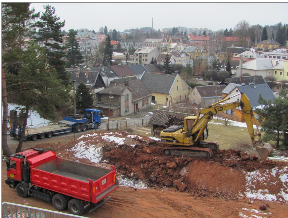
Odvoz zeminy z prostranství před objektem CBB – příprava na pokládku makadamu – březen 2013

Následující fotografie zachycují některé z doposud realizovaných prací v rámci úprav venkovního prostranství objektu CBB, práci dobrovolníků apod.