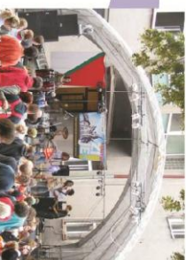
Klášter žijel ŽBB, Nová Páče