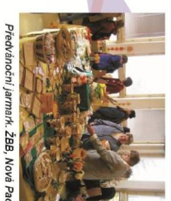
Předvánoční jarmark, ŽBB, Nová Páče

Wspólnie organizujemy kilka imprez w Czechach i w Polsce. Przykładami są w Czechach: Gry bez granic, Dzień Otwartych drzwi, festiwal multikulturalny Klášter žijel oraz w Polsce Piknik Dolnosaski itd... Przy spotkaniach partner z Polski porozumie lepiej mentalności Czechów, aktywności sfery społecznej i posądzi różności w tym tematu między Czechami i Polską. Podczas w Czechach wizytę tygodniowej partnerów polskich, chcemy obznajmit partnera z szeregami tradycji podkarkonoszkich i też dać możliwość partnerowi wziąć udział w jakiś działaniach naszej organizacji i wziąć udział w kursie językowym. Liczymy z wycieczką jednodniową do Polski. Akcją będzie nastawiana na aktywności sportowe i kulturalne w Polsce. Podczas wizytę poznajemy czynność socjalną organizacje i następane aktywności partnera (to znaczy: bezbarierowość i inne aktywności). Celem jest wymiana informacji, doświadczeń i aplikacja nowych wiadomości. W ramach wizyty roboczo w Polsce wspólnie będziemy oceniać preciąg tych aktywności, będzie określony harmonogram do następnego okresu i udział przy czynnościach każdego dnia w organizacji bieżących.