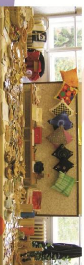
Výrobky chráněné dílny, ŽBB, Nová Páče

Wspólnie organizujemy kilka imprez w Czechach i w Polsce. Przykładami są w Czechach: Gry bez granic, Dzień Otwartych drzwi, festiwal multikulturalny Klášter žijel oraz w Polsce Piknik Dolnosaski itd... Przy spotkaniach partner z Polski porozumie lepiej mentalności Czechów, aktywności sfery społecznej i posądzi różności w tym tematu między Czechami i Polską. Podczas w Czechach wizytę tygodniowej partnerów polskich, chcemy obznajmit partnera z szeregami tradycji podkarkonoszkich i też dać możliwość partnerowi wziąć udział w jakiś działaniach naszej organizacji i wziąć udział w kursie językowym. Liczymy z wycieczką jednodniową do Polski. Akcją będzie nastawiana na aktywności sportowe i kulturalne w Polsce. Podczas wizytę poznajemy czynność socjalną organizacje i następane aktywności partnera (to znaczy: bezbarierowość i inne aktywności). Celem jest wymiana informacji, doświadczeń i aplikacja nowych wiadomości. W ramach wizyty roboczo w Polsce wspólnie będziemy oceniać preciąg tych aktywności, będzie określony harmonogram do następnego okresu i udział przy czynnościach każdego dnia w organizacji bieżących.