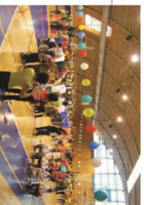
Hry bez hranic ŽBB, Nová Páče

Společně organizujeme několik akcí v České republice a v Polsku. Jsou to například v ČR: Hry bez hranic, Den otevřených dveří, multikulturní festival Klášter žijel nebo v Polsku Piknik Dolnosaski a další. Při setkáváních polský partner pozná lépe mentalitu Čechů, činnost v sociální oblasti a posoudí odlišnost od Polska. Při týdenním pobytu polských partnerů v České republice chceme seznámit partnera podrobněji s tradicemi Podkrkonoší. Také se budou přímo spolupodílet při chodu určitých činností ve sdružení Život bez barier, zúčastní se jazykového kurzu. Počítáme s jednodenními návštěvami do Polska. Akce bude zaměřena na sportovní, kulturní aktivity. Během setkání sdružení pozná činnost v sociální oblasti organizace a aktivity partnera tzn. bezbariérovost a doplňkové aktivity. Cílem je výměna informací, zkušeností a aplikace nových poznatků. V rámci pracovní návštěvy v Polsku bude společně zhodnocen průběh a realizace aktivit, stanoven plán na další období a účast při běžném pracovním chodu organizace.