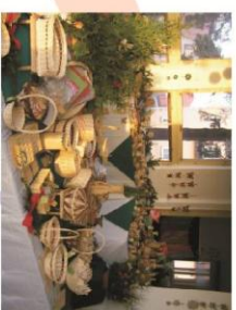
Jarní jarmark, ŽBB, Nová Páče

Po několikaleté spolupráci s Polským sdružením nevidomých nám byla v roce 2011 od Euroregionu Glacensis schválena dotace na česko-polskou spolupráci v hodnotě 21.632,50 EUR.